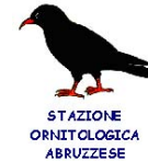
SOA, Stazione Ornitologica Abruzzese http://www.soabruzzo.it