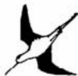
Stazione Romana per l'Osservazione e la Protezione degli Uccelli http://www.sropu.it