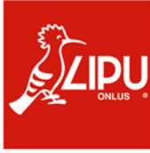
LIPU, Lega Italiana Protezione Uccelli http://www.lipu.it