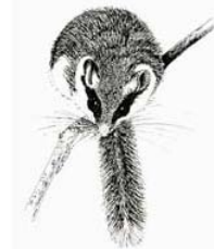
As.Fa.Ve, Associazione Faunisti Veneti http://www.faunistiveneti.it