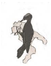
Associazione Studi Ornitologici Italia Meridionale http://www.asoim.org